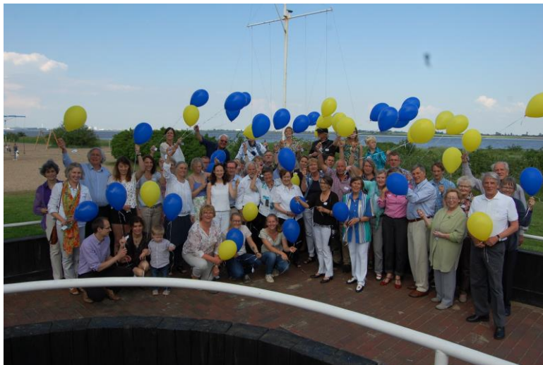
Familienstag 2016 am 04. Juni 2016 in Nordenham